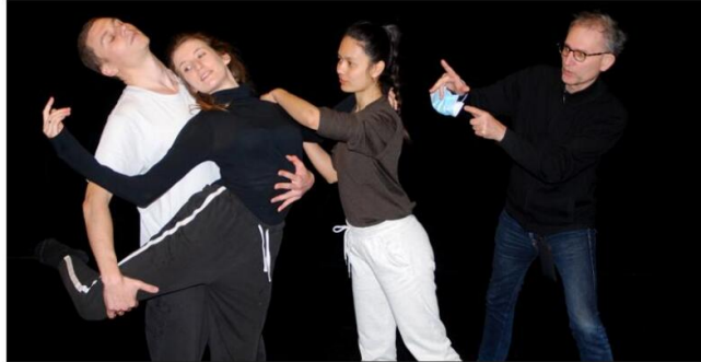
L'origine du spectacle créé par Jean-Claude Gallotta est une collaboration avec ses trois danseurs et un saxophoniste.

Propos recueillis par Véronique CHANCRIN